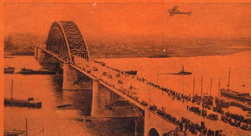
De Waalbrug te Nijmegen

UITGESCHREVEN DOOR DEN NEDERLANDSCHEN BOND VOOR LICHAMELIJKE OPVOEDING