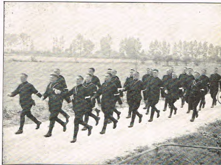
Amsterdamsche Politie op marsch.