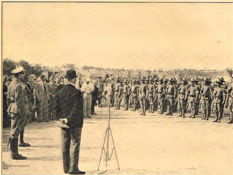
De Koloniale Reserve. Oud-Minister-President Z.E. Dr. H. Colijn spreekt het detachement toe.